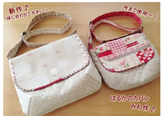
新作♪ (体に合わせて大きく！)